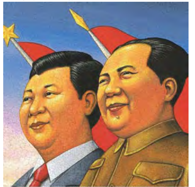
Си Цзиньпин и Мао Цзэдун

На XX съезде в 2022 был принят курс на усиление социалистического основ, но из-за трудностей начали срочно тормозить, потому что источник сил не социалистическая экономика, а рыночная. И я ожидаю решений в пользу рыночной экономики. Распределение же компартия видит по-прежнему социалистическим. На XX съезде одна из ключевых стратегий называется «всеобщее процветание». Если за первые 10 лет правления Си Цзиньпина была достигнута «средняя зажиточность», то теперь они хотят всеобщую. Сразу после съезда они резво стали проводить это в жизнь. Например, крупнейшие промышленные гиганты предупредили, что не должно быть никаких картельных сговоров, никакого давления на малый и средний бизнес,