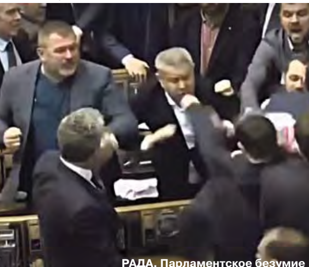
РАДА. Парламентское безумие

Законопроект должен пройти второе чтение. Для вступления в силу закон должен быть подписан президентом Украины.